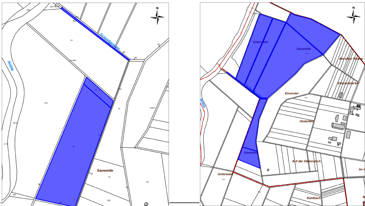
Umgrenzung der Flächen in der Gemarkung Groß-Karben bzw. Burg-Gräfenrode

Zugeordnet werden Maßnahmen aus dem Bereich "Einsiedel" in Burg-Gräfenrode (Niddarenaturierung und Schaffung von Retentionsraum). Die Maßnahmen liegen auf folgenden Flurstücken: Gemarkung Groß-Karben, Flur 6, Flurstücke 2/1, 2/2 und 51/2 sowie Gemarkung Burg-Gräfenrode Flur 2, Flurstücke 29-32, 34 und 35, 50 und 64-66/2.