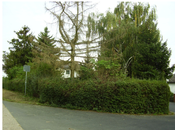
vorhandene private Grünfläche

Da es im Ursprungsbebauungsplan keine Festsetzungen bezüglich der Anlage bzw. Bepflanzung der Grünfläche gab, werden auch keine neuen Festsetzungen hierzu getroffen. Lediglich die Versiegelung wird eingeschränkt – sie ist außer für Gartenwege unzulässig.