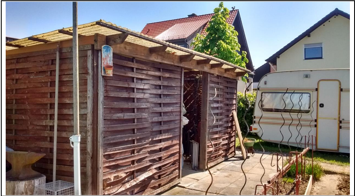
Abb. 5: Gartenhütte mit mäßigem Potenzial an Spaltenquartieren