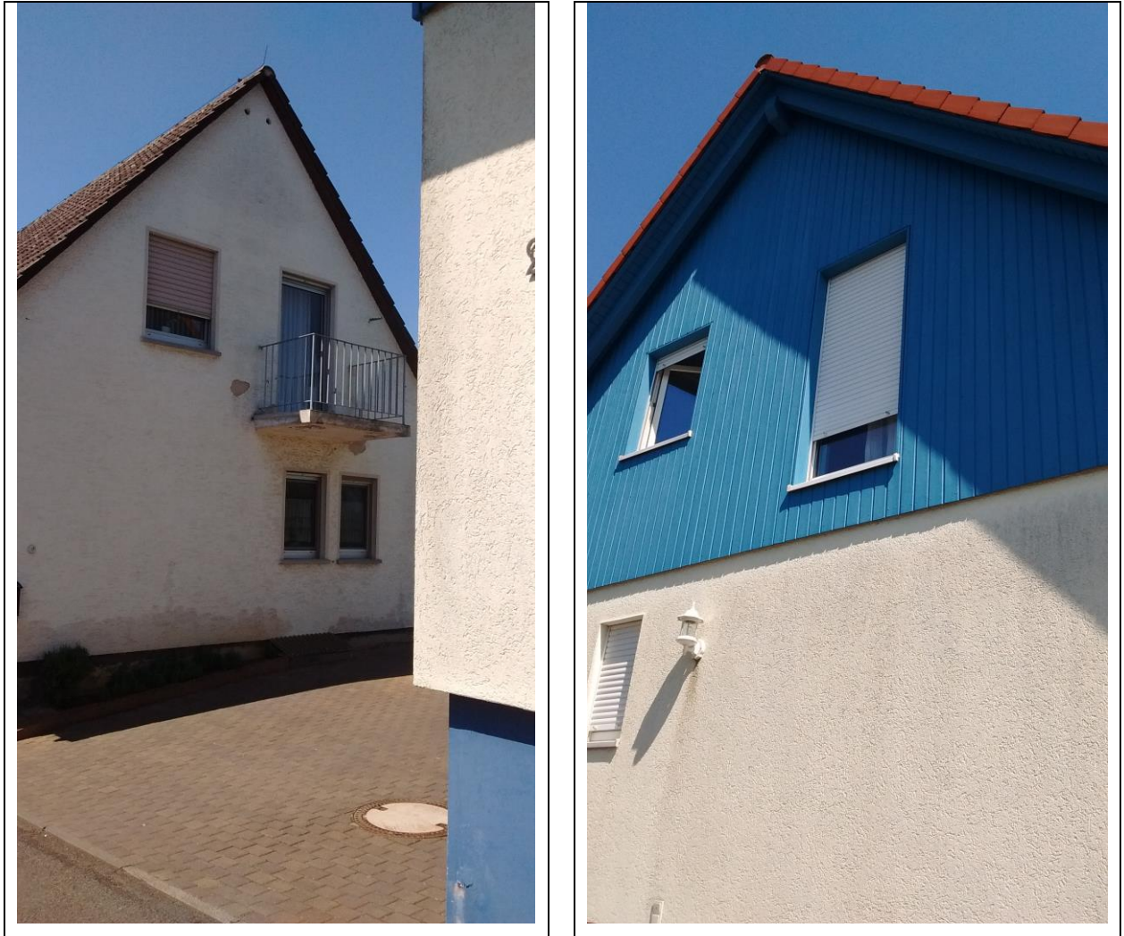
Abb. 8: Details der Hausfassaden mit mäßigem Quartier- und Nistplatzpotenzial

Auch wenn aktuell keine Hinweise auf besetzte Niststätten von Vögeln gefunden wurden, können bis zum Beginn einer zusätzlichen Bebauung durch die Beseitigung von Bäumen und Sträuchern sowie von Gartenhütten Fortpflanzungs- und Ruhestätten verloren gehen. Gleiches gilt bei einer ggf. geplanten Aufstockung der vorhandenen Gebäude. Vor diesem Hintergrund sind Vermeidungsmaßnahmen vorzusehen (vgl. Kapitel 2.5).