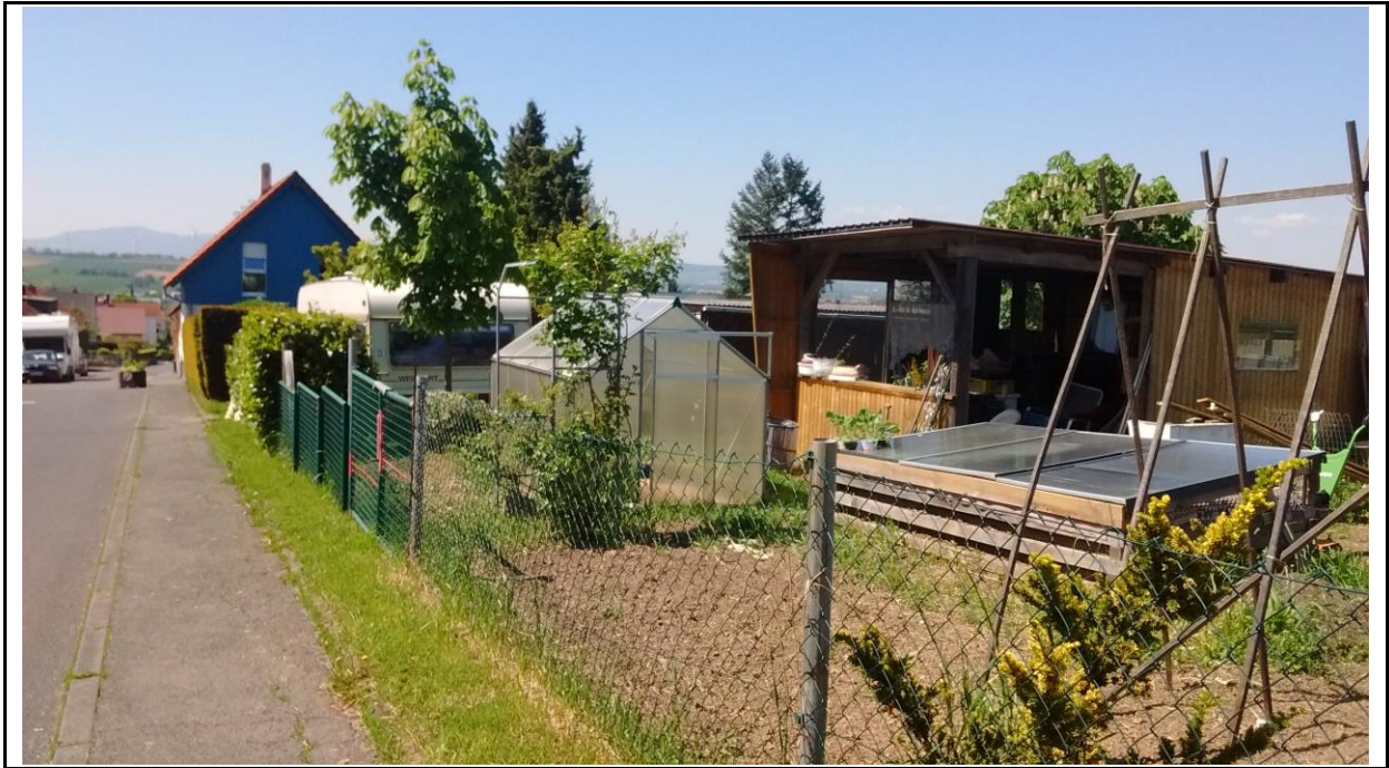
Abb. 3: Gartenflächen im östlichen Plangebiet