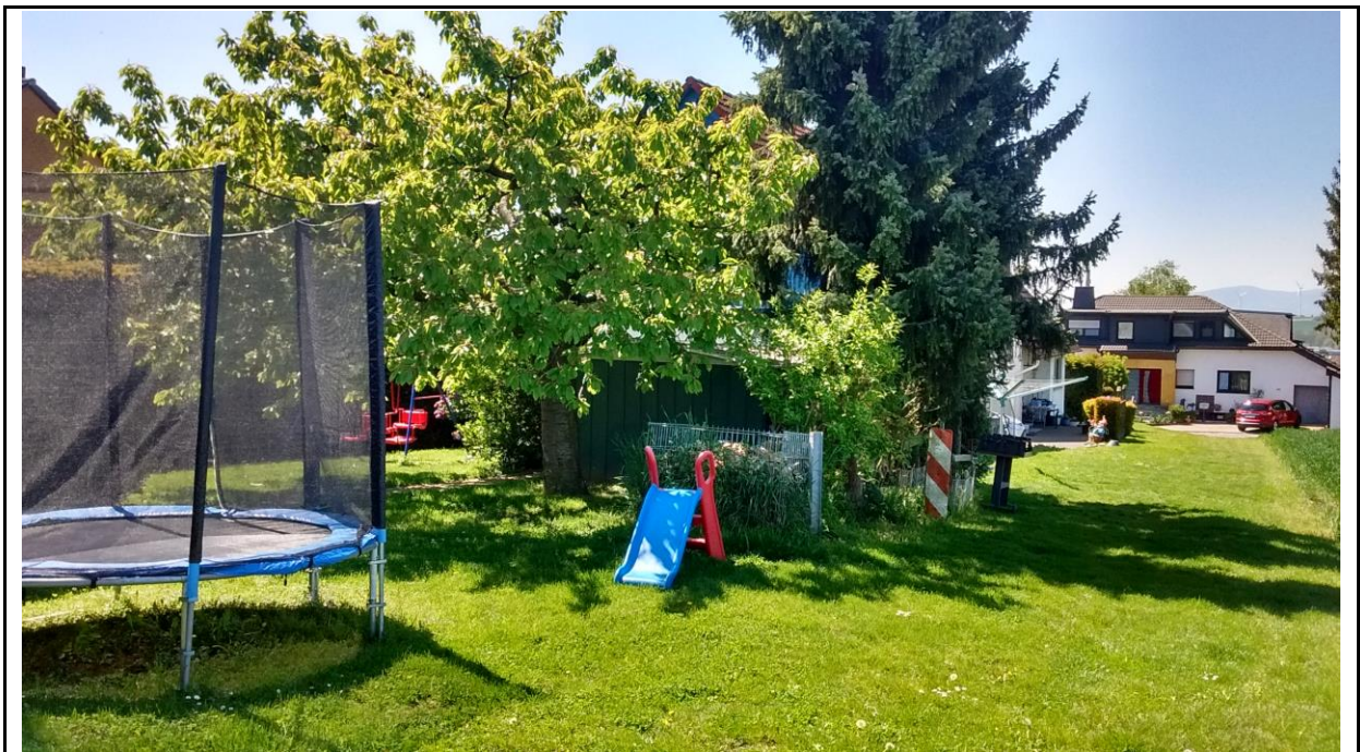
Abb. 4: Zentraler Baumbestand an der nördlichen Grenze des Geltungsbereiches