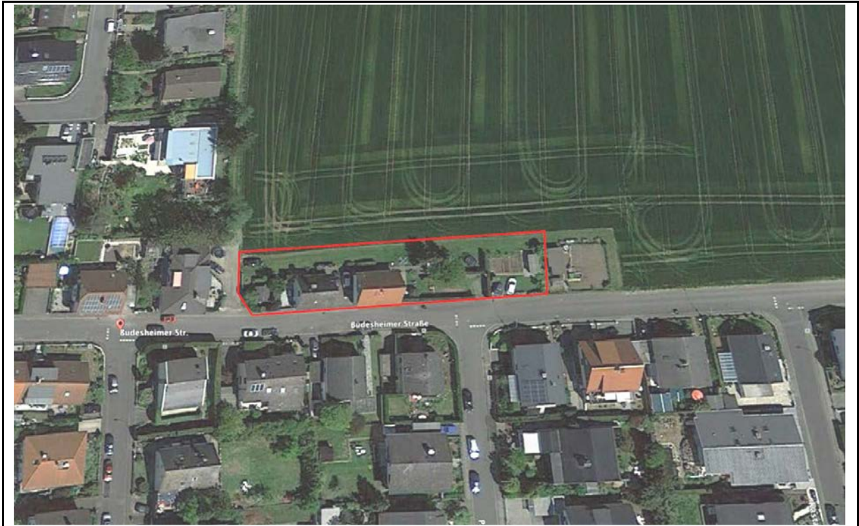
Abb. 1: Lage des Plangebietes (rot)