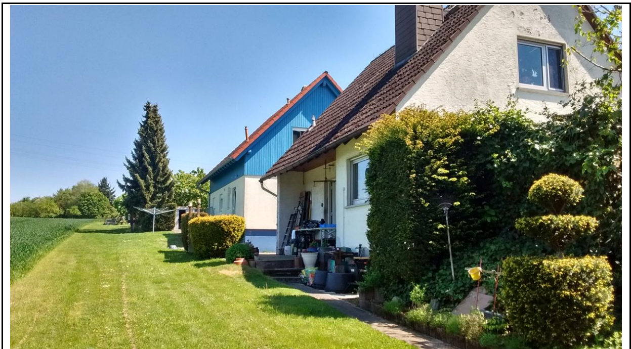
Abb. 6: Vorhandene Einzelhaus-Bebauung