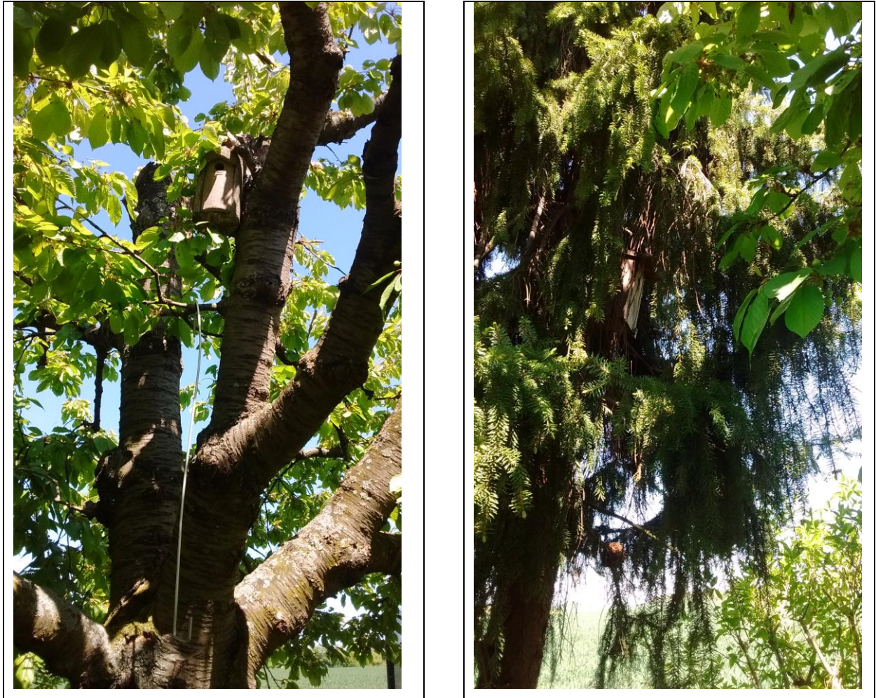
Abb. 7: Details des Baumbestands mit Nistkästen

An den vorhandenen Hauptgebäuden und Gartenhütten wurden keine Nester gebäudebrütender Arten, insbesondere keine Schwalbennester festgestellt. Ein gewisses Potenzial an Überständen und Vorsprüngen oder Gebäudenischen ist zwar gegeben; ein Besatz aufgrund der gegebenen Nutzung der Wohngebäude und baulichen Strukturen aber unwahrscheinlich. Bis zu einer Beseitigung von Gartenhütten oder baulichen Veränderungen an den vorhandenen Wohnhäusern können ggf. Hausrotschwanz oder Hausperling Niststätten begründen.