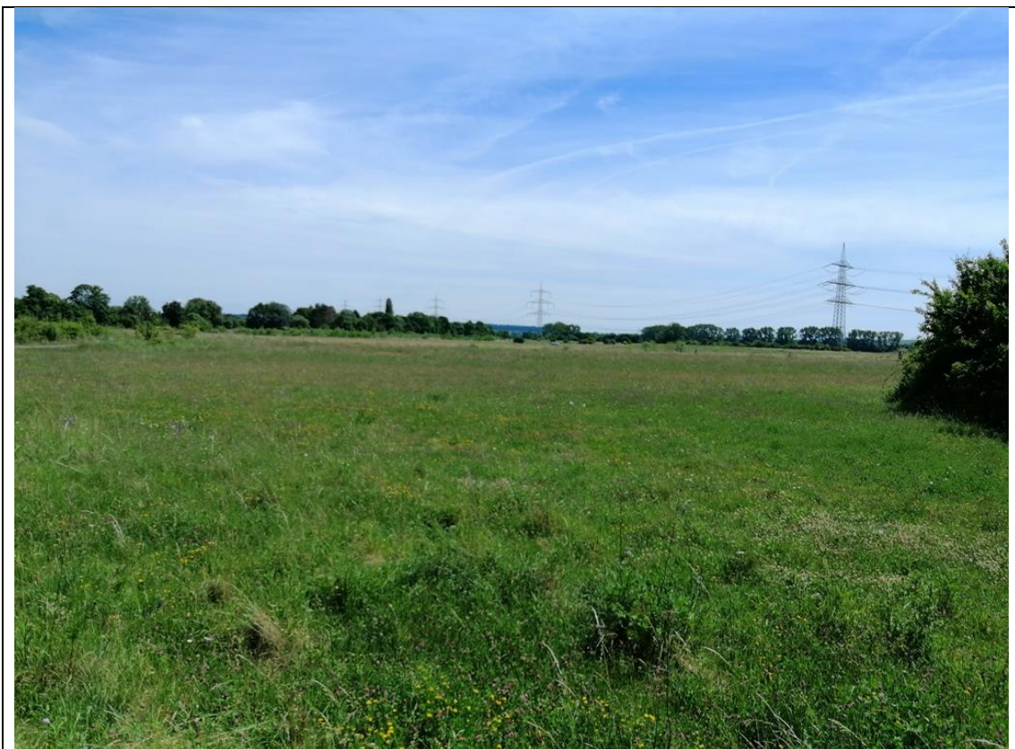
Abbildung 5: Extensivwiese im Änderungsbereich 2