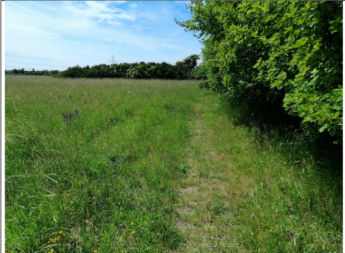
Abbildung 4: Baumhecke und Saum am südlichen Rand der Recyclinganlage