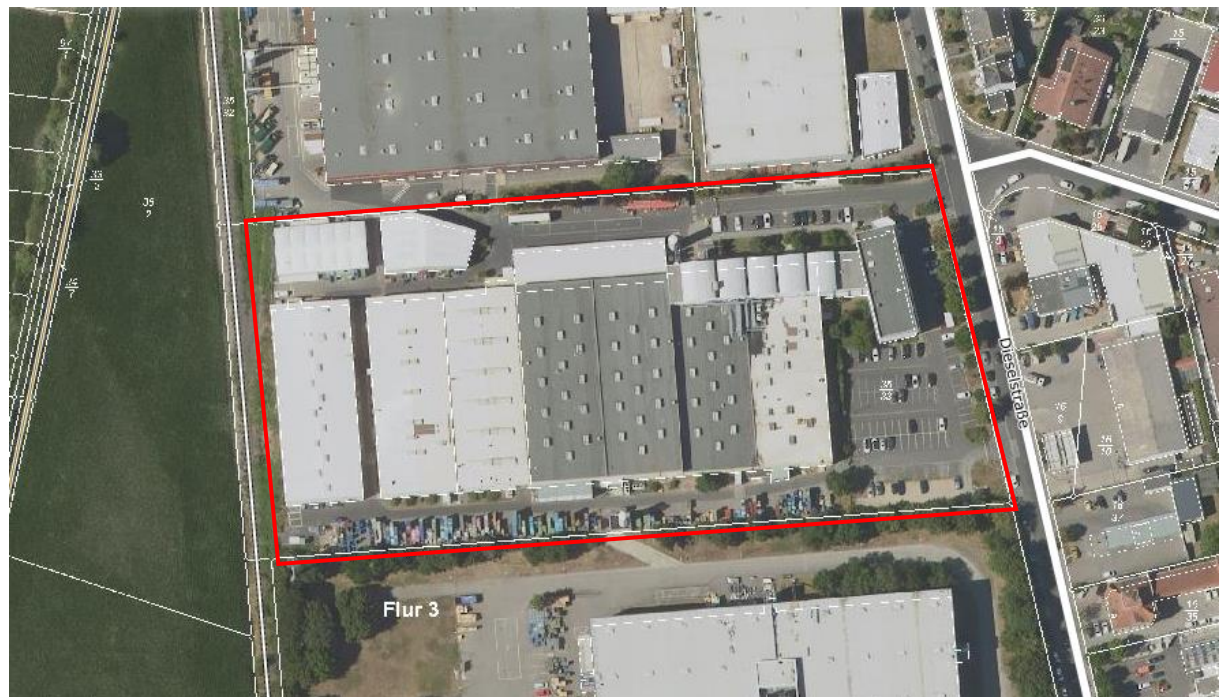
Abbildung 2: Biotopstruktur im Änderungsbereich 1: (gärtnerisch gepflegte Anlagen innerhalb von Gewerbeflächen)