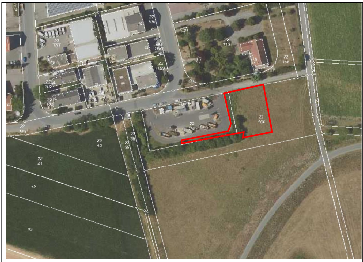
Abbildung 3: Biotopstruktur im Änderungsbereich 2: (Baumhecke, Frischwiese, extensiv)