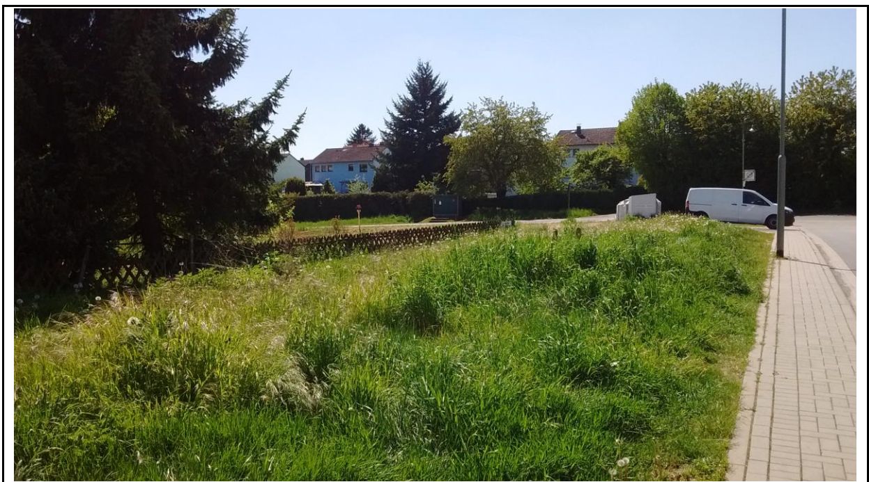
Abb. 5: Ruderale Wiesenvegetation an der Rhönstraße