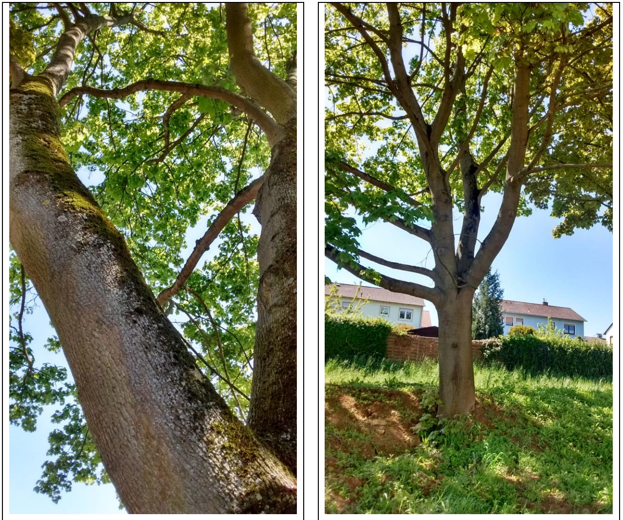
Abb. 7: Details der Baumgruppe an der Frankfurter Straße (Spitz-Ahorn)

sichts der Lage und Dimensionierung der Wiese, sowie der Frequentierung durch Hunde nicht anzunehmen. Als potenzielle Brutvögel in der Baumgruppe kommen u. a. Arten wie Amsel, Buchfink, Grünfink, Mönchgrasmücke, Singdrossel, Misteldrossel und Schwanzmeise in Betracht. Größere Nester von beispielsweise Elster, Rabenkrähe oder Ringeltaube wurden nicht festgestellt. Ein Besatz durch diese Arten ist jedoch grundsätzlich möglich. Als Nahrungsgäste, die in umliegenden Gebüsch, Nistkästen oder an Gebäuden brüten, können z. B. Blaumeise, Hausrotschwanz, Kohlmeise, Star, Girlitz und Hausperling vorkommen. Mit Ausnahme der beiden letztgenannten befinden sich diese Arten in Hessen in einem günstigen Erhaltungszustand. Da Girlitz und Hausperling den Geltungsbereich des Bebauungsplanes allenfalls als Teil eines größeren Nahrungshabitates nutzen, ist das Eintreten von Verbotstatbeständen gemäß § 44 BNatSchG ausgeschlossen.