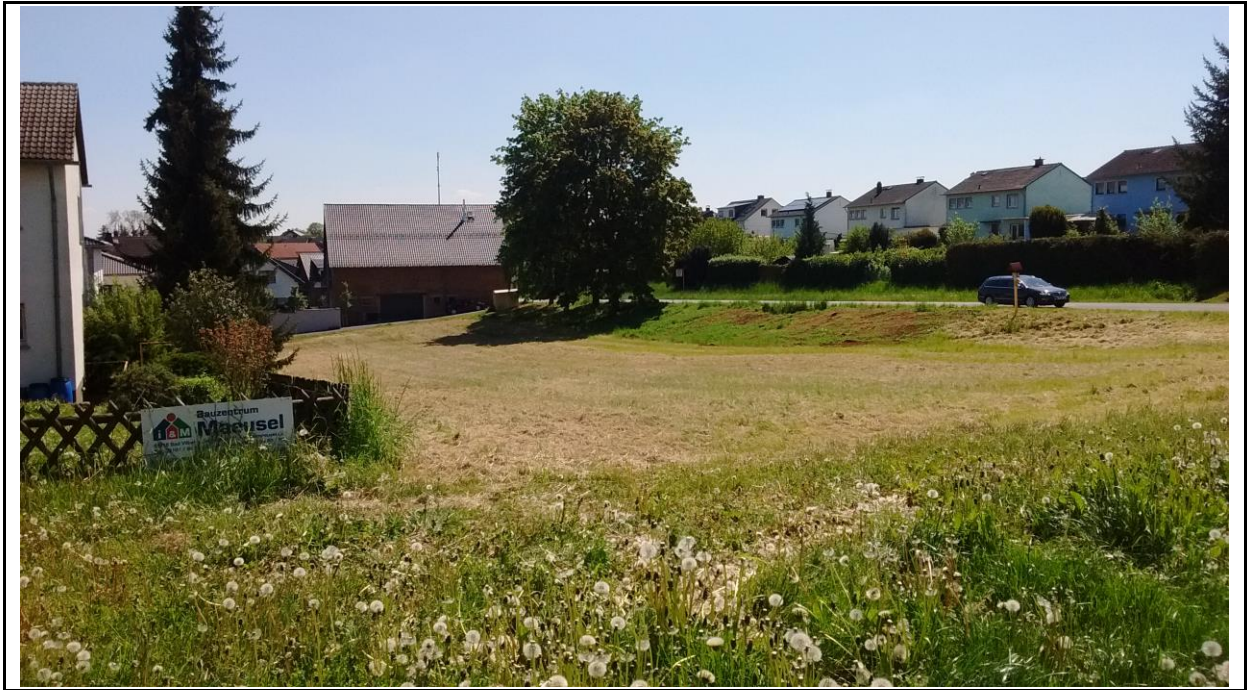
Abb. 6: Blick aus Richtung Nordosten über die Wiesenfläche im Geltungsbereich