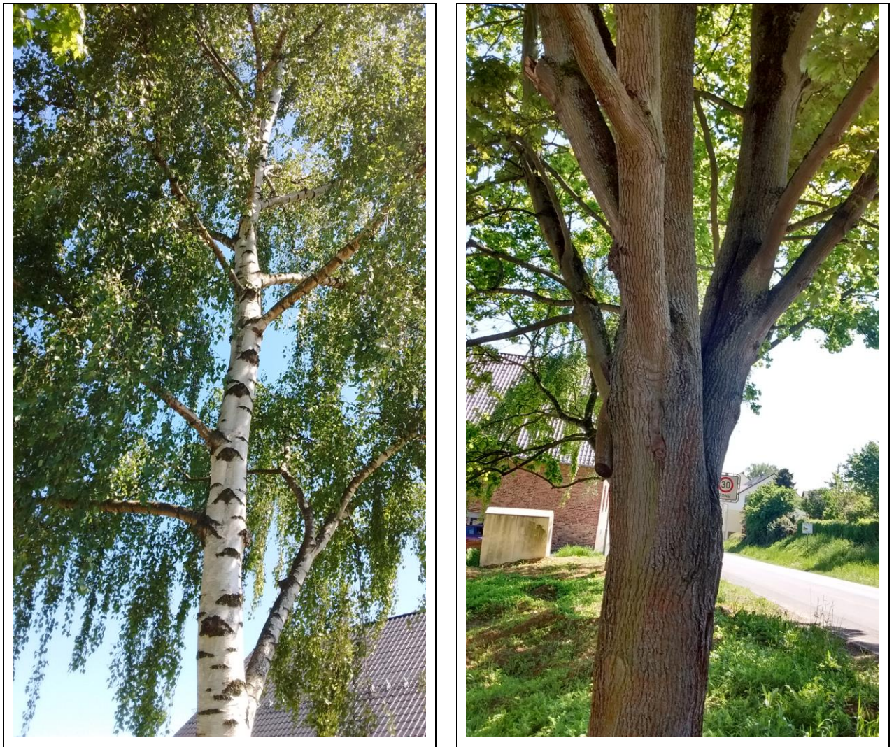
Abb. 8: Details der Baumgruppe an der Frankfurter Straße (Hänge-Birke rechts, Spitz-Ahorn links)

In Verbindung mit einer Bebauung des Plangebietes können Fortpflanzungs- und Ruhestätten allenfalls durch Schädigung oder Beseitigung der Baumgruppe verloren gehen, sofern die Bäume nicht erhalten werden können. Der Baumbestand wird zwar aktuell hierfür nicht erkennbar genutzt, allerdings könnte es sich ergeben, dass bis zum Baubeginn ein Besitz erfolgt. Vor diesem Hintergrund sind Vermeidungsmaßnahmen vorzusehen (vgl. Kapitel 2.6):