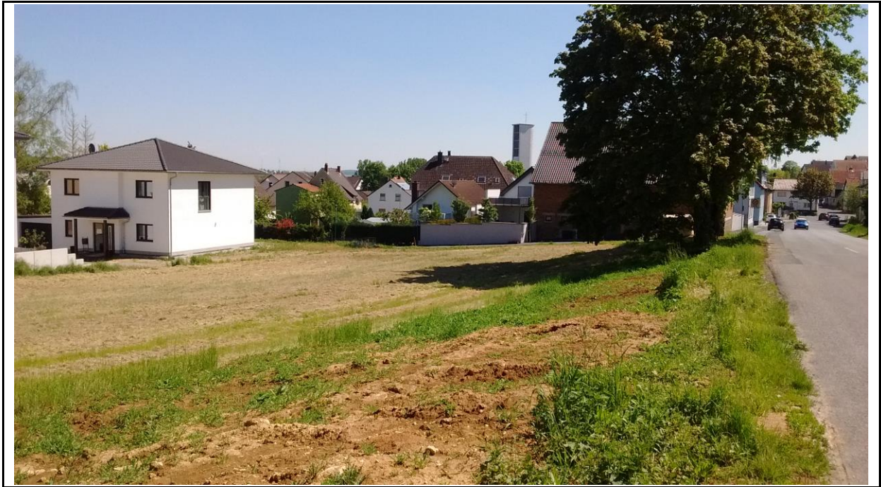
Abb. 4: Blick aus Richtung Nordwesten über die Wiesenfläche im Geltungsbereich