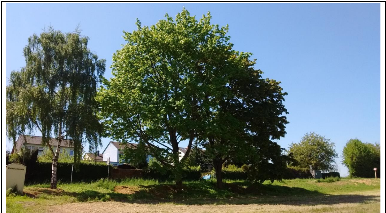
Abb. 3: Baumbestand an der Frankfurter Straße

In den folgenden Kapiteln liegt der Fokus auf den europarechtlich geschützten Pflanzen- und Tierarten des Anhangs IV FFH-RL, Art. 1 VSchRL und/oder Verordnung (EG) Nr. 338/97, die innerhalb des Plangebiets strukturbedingt, d. h. im Zusammenhang der dort gegebenen Habitatstrukturen und Lebensraumbedingungen, vorkommen könnten.