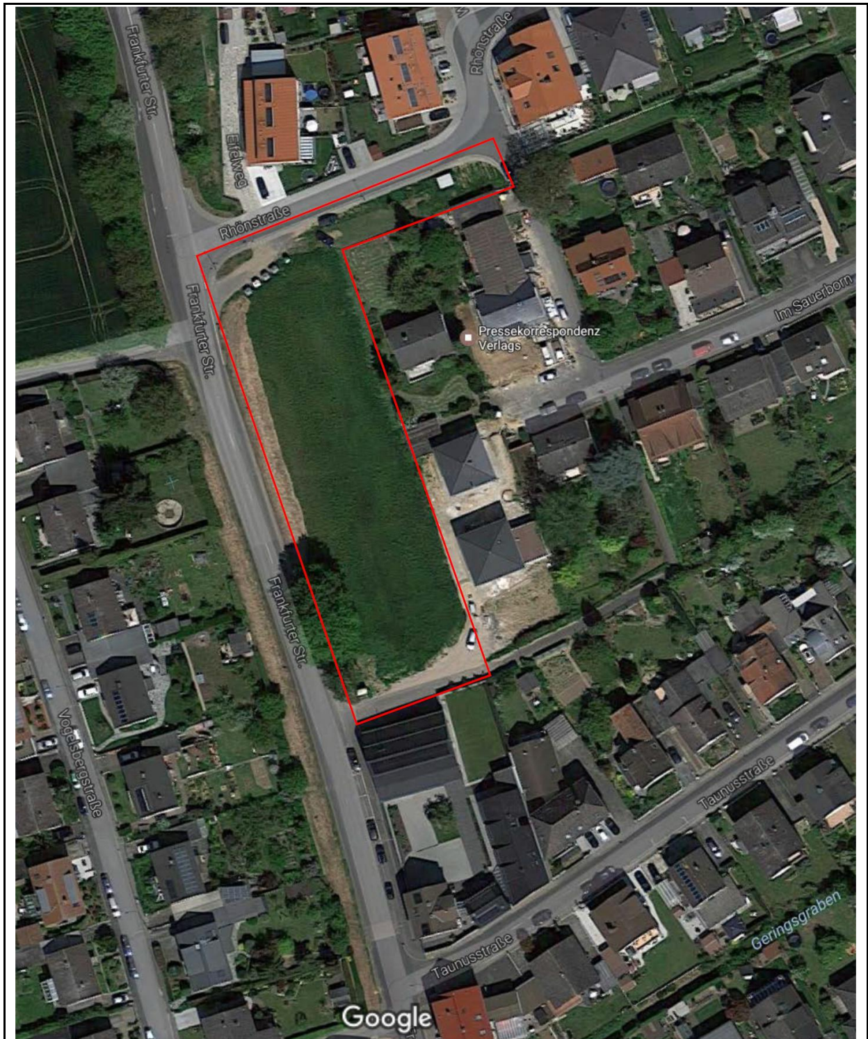
Abb. 1: Lage des Plangebietes (rot)