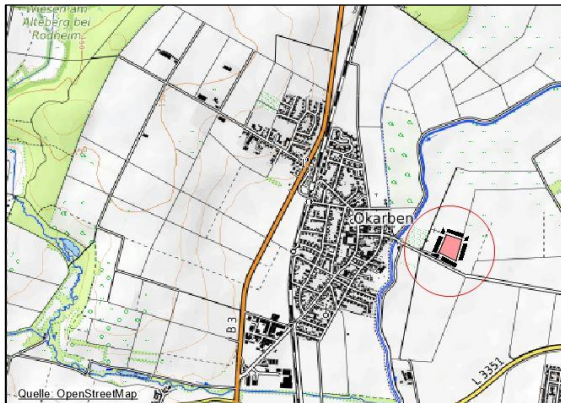
Lage des Plangebietes (ohne Maßstab)